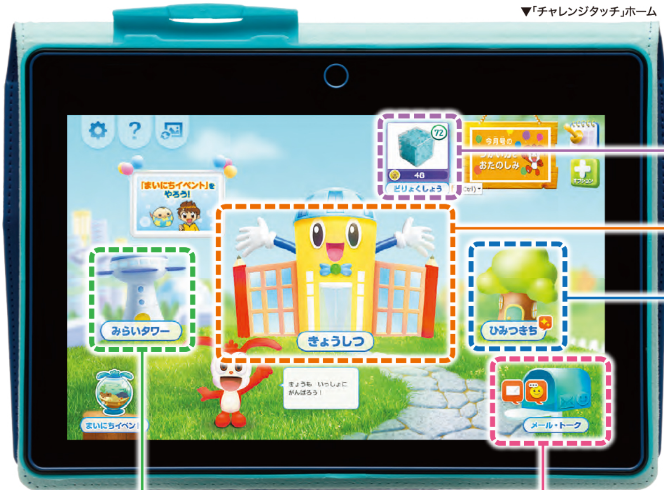
▼「チャレンジタッチ」ホーム